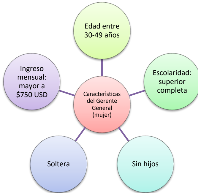
Diagrama 1. Características de la mujer como gerente general en hoteles de Toluca, México 2016