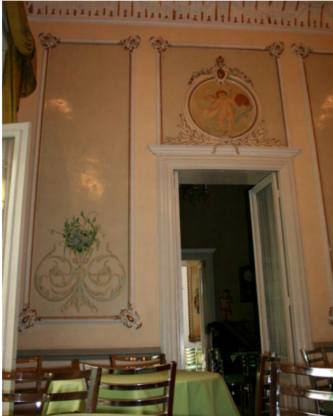
Figuras 02. y 03.

Interiores de una casa porfiriana en Toluca, calle Independencia oriente n. 408 (Estado de México).