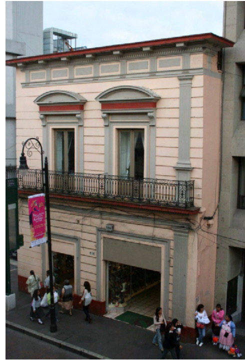
Figura 01. Casa porfiriana en Toluca, calle Hidalgo poniente n. 201 (Estado de México).

La casa como espacio poético, como nido, como hogar, contiene una inmensidad de asociaciones gratas, de reminiscencias. Pero si miramos en sentido contrario, la pérdida del hogar, su vulnerabilidad o destrucción representa para los seres humanos uno de los traumas más dolorosos. Simboliza la pérdida de referencia, de centro, de lugar de partida y de llegada, de encuentro, de continuidad y de rastro (Cabrera, 2015, p. 12).