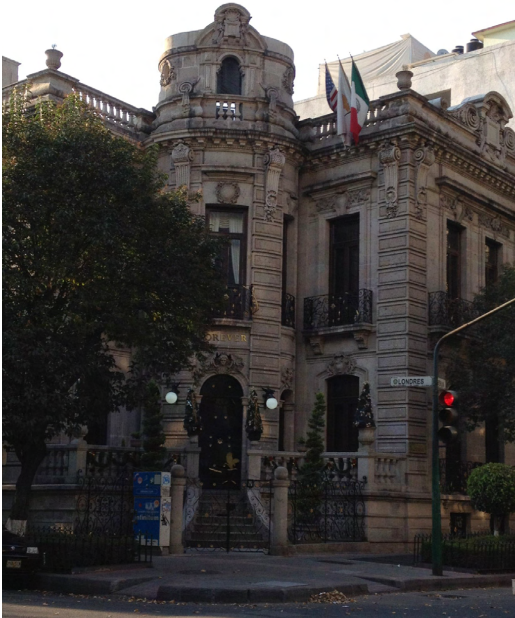
Figura 05. Casa porfiriana en la ciudad de México, calle Londres n. 113, esquina con calle Berlín (Delegación Cuauhtémoc de Ciudad de México).