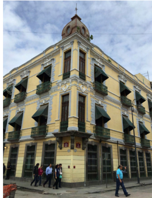
Figura 06. Casa porfiriana en Puebla, avenida Tres poniente n. 302, esquina con calle Tres sur (Estado de Puebla).

Ahora bien, si un orden social constituido da cabida a la existencia de algunas diferencias entre los miembros que lo generan, estas distinciones, a su vez, son admitidas únicamente en un grado tal que no produzcan disonancia entre un individuo y el resto de la comunidad y permitan la conservación (o perpetración) de una norma heredada ancestralmente. Es así que Goffman (1981) concibe el cuerpo como un instrumento fundamental para la acción cotidiana de las personas en los órdenes micro y macro de la sociedad, en otras palabras, es el territorio en donde las acciones individuales y las colectivas suceden, ello dependiendo de la naturaleza y la sociedad de los seres humanos. Por su parte, Michel Foucault (1977) establece que la relación que existe entre el cuerpo individual y el cuerpo social es una relación de poder, en la que el cuerpo social le impone una forma de conducirse al individual. Desde esta perspectiva, en un cualquier grupo social, los cuerpos que son radicalmente opuestos al ideal no solo son menos aceptables sino también menos utilizables. Como propone Judith