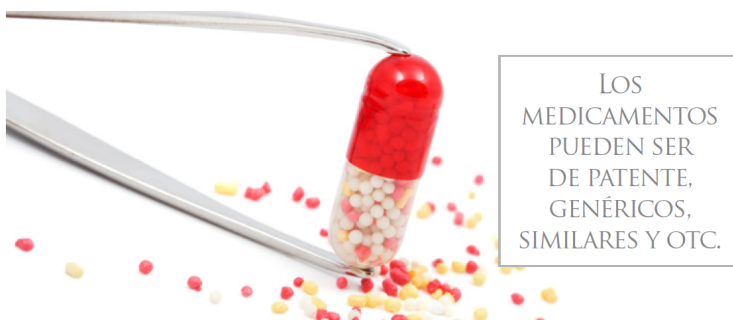
Figura 6: Fragmento de Industria Farmacéutica Unidad Inteligente de negocios , Secretaría de Economía 2013, p. 4.

La figura 6 muestra un fragmento de esta publicación oficial.