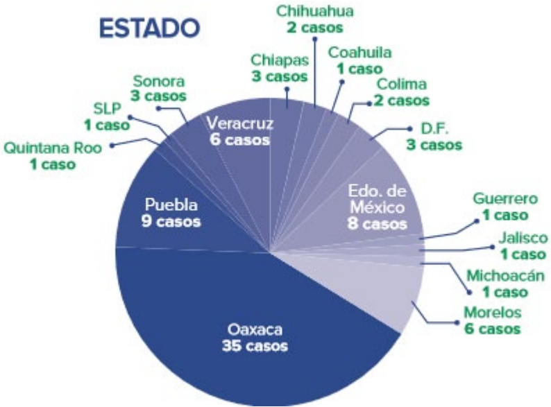
Figura 2. Activistas en riesgo en México por estado.