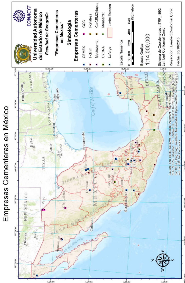
Figura 3. Mapa de localización de plantas de cemento en México, 2015.