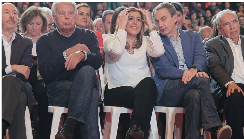
5 La candidata Susana Díaz con (de izquierda a derecha) Rubalcaba, González, Zapatero y Puig

Finalmente debe tomarse en cuenta que el PSOE, de acuerdo al artículo 35 de los Estatutos Generales, se integra orgánicamente por un Comité Federal, integrado por los líderes locales, el Secretario General, un portavoz diputado y un portavoz senador y un Comité Ejecutivo (Veáse Anexo 2. PSOE-35)