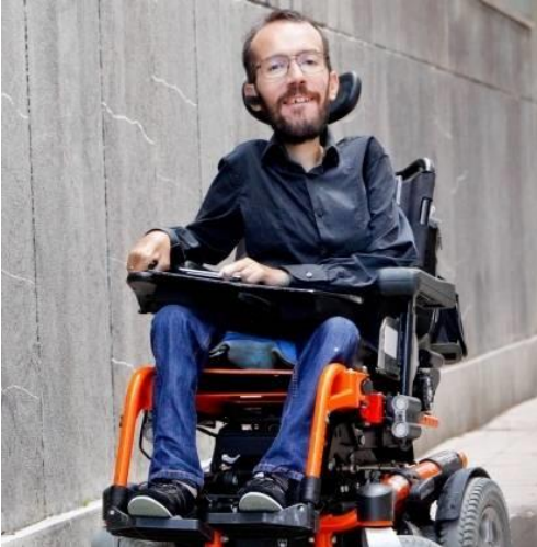
4Pablo Echenique

Pablo Echenique Robba nació en Rosario, Argentina el 28 de agosto de 1978. Cuenta con doble nacionalidad, española y argentina. Llegó a España cuando tenía 13 años