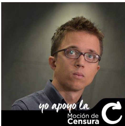
2 Iñigo Errejón, tomada de su twitter personal

Iñigo Errejón Galván es el segundo al mando dentro de PODEMOS, no solo jerárquicamente sino ideológicamente, es gran amigo de Pablo Iglesias, incluso ha llegado a competir por la dirigencia nacional del partido. Nació el 14 de diciembre de 1983 en Madrid. Es licenciado y Doctor en Ciencia Política por la Universidad Complutense de Madrid, del cual se tituló con un trabajo relacionado al Movimiento al Socialismo (MAS) de Bolivia, mismo trabajo llevó a