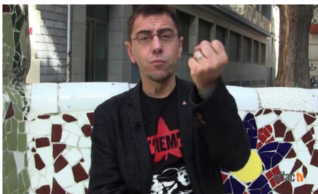
3Juan Carlos Monedero, imagen tomada de su twitter personal

Juan Carlos Monedero es uno de las principales figuras del partido, sin ser líder, sino más bien ideólogo y padre fundador del partido y adicionalmente sin ser ya inclusive militante del partido, del cual renunció en 2015, pero tiene aún una estrecha relación. Tiene una amplia experiencia política al ser