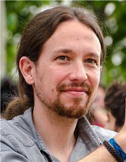
1 Pablo Iglesias.