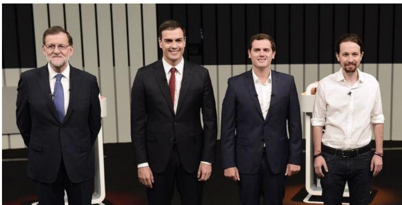
De izquierda a Derecha, Rajóy, Sánchez, Rivera e Iglesias en un debate de candidatos

Las personas que en calidad de Secretarios Generales se postularon al intento de Investidura fueron Pedro Sánchez Pérez-Castejón del PSOE. Pablo Manuel Iglesias Turrión por PODEMOS, Mariano Rajoy Brey por el PP y Albert Rivera Díaz, por CIUDADANOS.