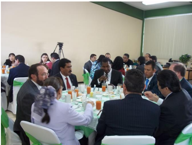
Desayuno del Día del Maestro 13/mayo/ 2011