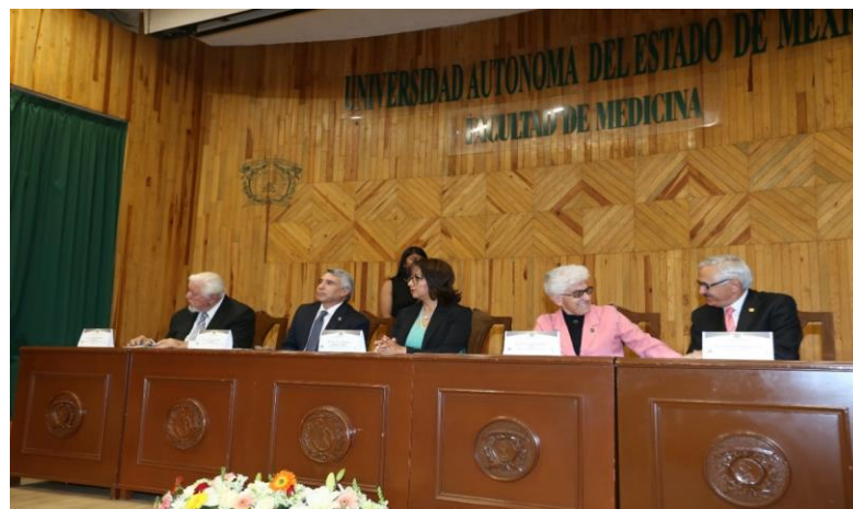
Imagen 4 Integrantes del Presídium de la Ceremonia de Clausura del 63 Aniversario.