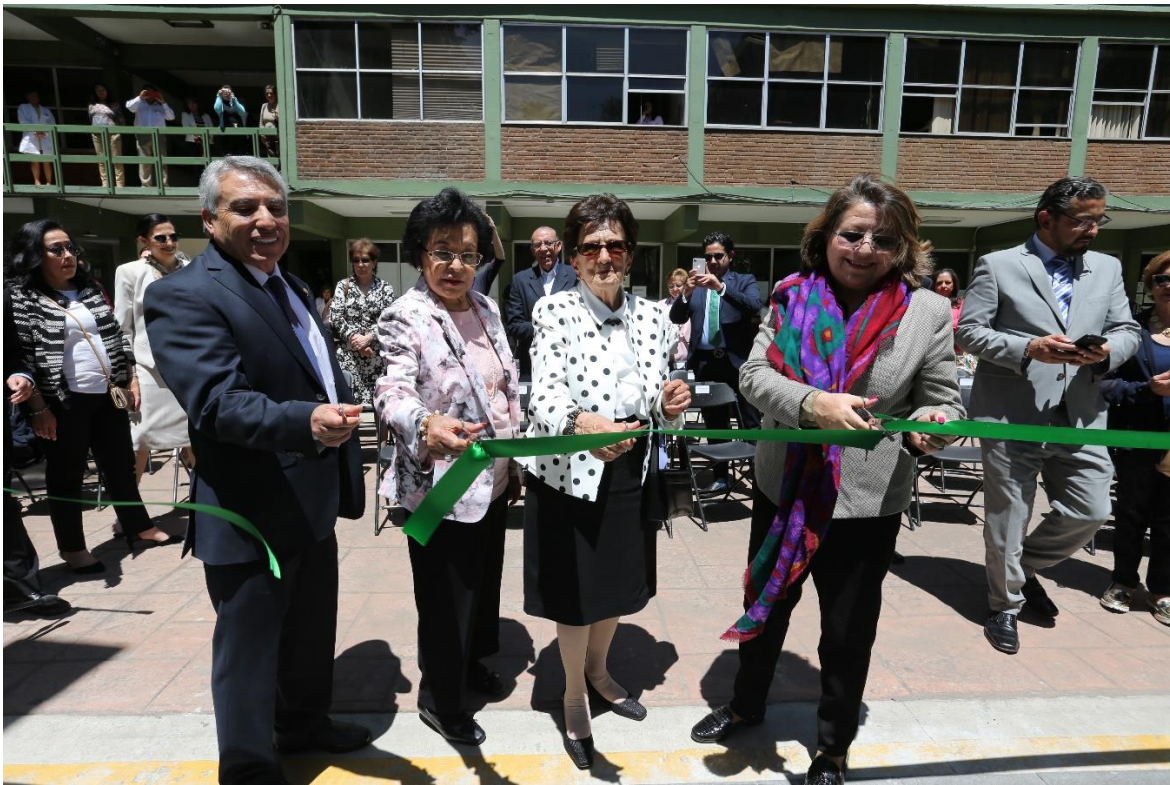
Imagen 9 Inauguración del Memorial a Fundadores.