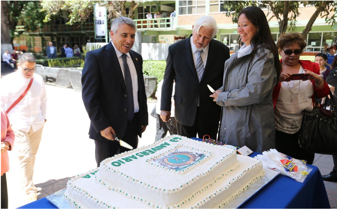
Imagen 11 Partida de Pastel del 63 Aniversario.

Estos festejos son el refrendo del compromiso social que tiene nuestra Universidad para realizar actividades de divulgación del conocimiento científico y de los resultados de la atención de los servicios que se ofrecen a la comunidad mexiquense.