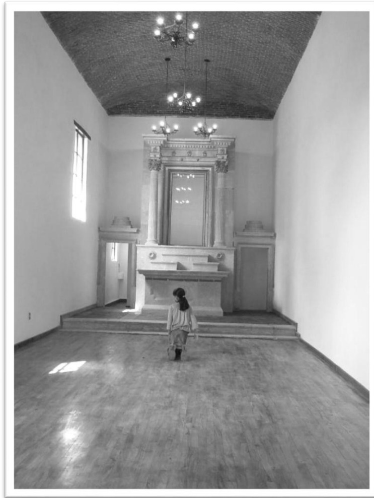
Figura 6. El altar principal de la capilla