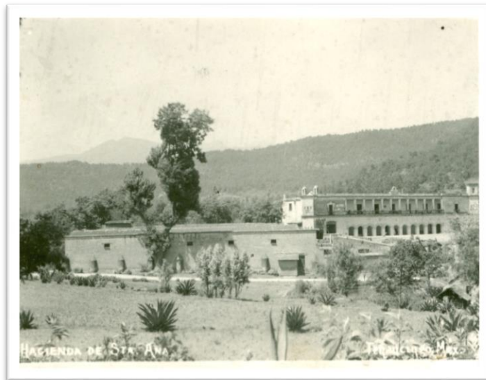
Figura 1.- La hacienda en 1920.