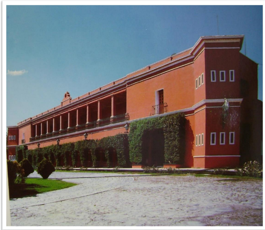
Figura 9. Vista del casco histórico en los años 70