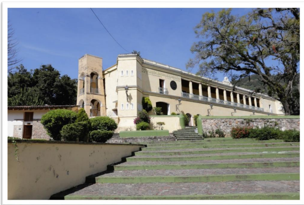
Figura 2. La Perla de la UAEMEX

La escasa documentación que sobrevive, se halla dispersa en diversos archivos estatales y federales que requerirán de años para su estudio y, en adelante, sea posible recrear lo que fue este importante escenario. Sobre la época de construcción no se cuenta con referentes claros, pero algunos documentos que obran en el Archivo General de la Nación sugieren que data de principios del siglo XVII, época que corresponde con el repartimiento de tierras y sus pueblos que realizó la corona española. (Figura 2)