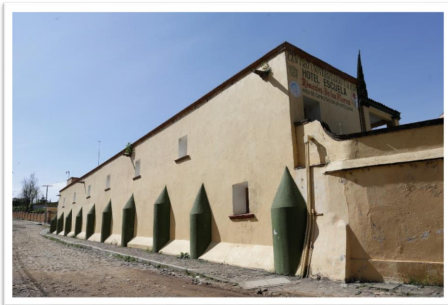
Figura 8. El semillero de la hacienda

Otro espacio que, hoy en día está ocupado por el Hotel Escuela “Las Flores”, tenía la función de “semillero”, es decir el lugar en el que se resguardaban granos de trigo y maíz, tanto para su comercialización, como para el cultivo. Se conservan de este edificio, los gruesos muros contruidos con adobes que resistieron el paso del tiempo. (Figura 8)