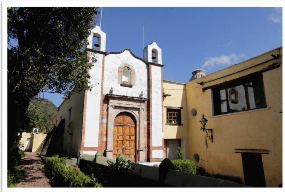
Figura 3. Vista frontal de la capilla

El hecho de que el interior de la capilla se dividiera en dos niveles se relaciona con la necesidad de reafirmar las diferencias sociales, en especial durante los servicios religiosos. El espacio superior, que correspondería con el coro, era en un pasillo en forma de “U” que rodeaba la mitad anterior del edificio al que se accedía por la habitación que en la actualidad es ocupado por el área de apoyo administrativo. De acuerdo con información proporcionada por el Sr. Pedro Balcázar 3 , “había una puerta y tenía un barandal, los dueños de la hacienda nada más salían de las piezas para oír la misa, no bajaban a la capilla y lo piones eran abajo” . En este comentario se expresan y materializan, las diferencias sociales que han caracterizado a la historia nacional, no en balde señalaba con profunda tristeza la Sra. Elvira Osorio García, que “hasta ante Dios hay diferencias” .