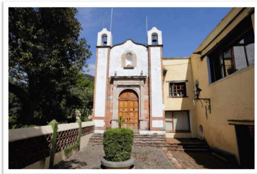
Figura 4. La Capilla de la hacienda

La capilla contaba con un pequeño atrio delimitado por muros de baja altura que, al parecer tenía un solo acceso situado en el extremo opuesto a la puerta principal de la capilla. Se dice que pudo haber funcionado como camposanto familiar, lugar reservado para los hacendados y sus familias. Este uso diferenciado de los espacios se debe a que desde la perspectiva local “hay quien puede estar más cerca de dios y su corte celestial”. (Figura 4)