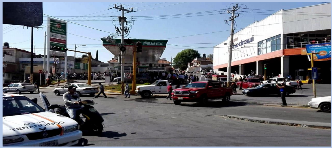
ILUSTRACIÓN 2. GASOLINERA UBICADA EN LA CALLE PETRONILO MONROY

La colectividad que a cada minuto se hacía más y más, sobre todo, sin fuerzas de seguridad que salieran al paso para detenerla, se lanzaba sobre los pasillos y estantes de la tiendas, tomaron todo lo que les fue, humanamente, posible cargar, muchos lo hicieron aprovechando cajas, bolsas, carritos, tinajas para hacerse de más productos, la tienda por dentro y por fuera era un hervidero, de saqueadores y también de curiosos que veían las acciones cual si fuese un espectáculo, o tal vez, en efecto, lo era. La tienda cuyo acceso principal es sobre la avenida Guadalupe Victoria, es parte de un conjunto de tiendas establecidas sobre la misma avenida, solo separada por una calle horizontal, frente al supermercado, se encuentra la firma Elektra, a unos metros más la tienda Coppel, y al final de la cadena de tiendas, farmacia Guadalajara, única tienda que no fue invadida; vasto una hora para que del supermercado quedara sólo caos y basura, hasta lo que había en los almacenes fue despojado.