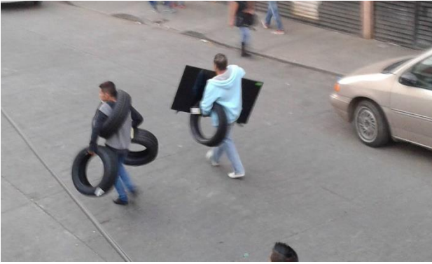
ILUSTRACIÓN 3. SAQUEADORES

momento, encontrándose con las cortinas metálicas que detuvieron momentáneamente sus fauces.