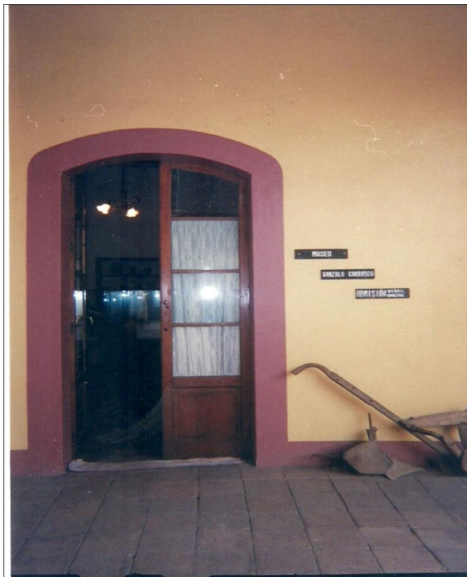
IMAGEN 11: Museo Gonzalo Carrasco