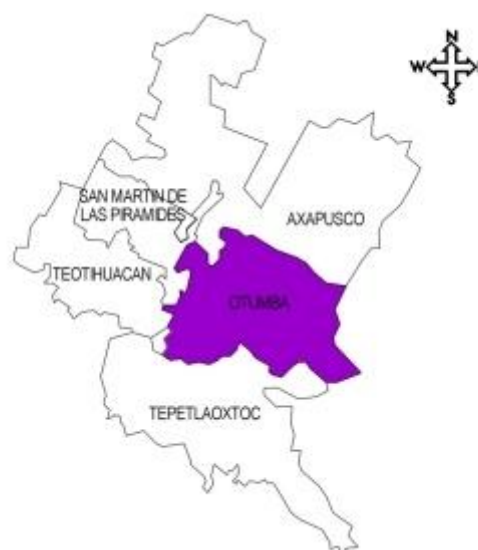
IMAGEN No. 2 Mapa de colindancias de Otumba

Se localiza en el extremo oriente del Estado de México, las coordenadas extremas son: máximas 19° 42' 55" latitud norte y 98° 49' 00" longitud oeste; mínimas 19° 35' 37" latitud norte y 98° 38' 48" longitud oeste, a una altura de 2349.41 m.s.n.m. Limita al norte con el municipio de Axapusco; al sur con el municipio de Tepetlaoxtoc; al sureste con el estado de Tlaxcala; al este con estado de Hidalgo y al oeste con el municipio de San Martín de las Pirámides (Plan de Desarrollo Municipal de Otumba; 2000:6).