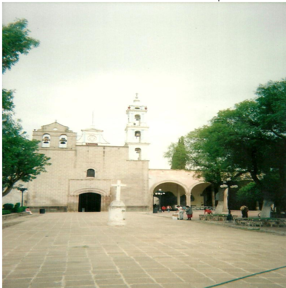
IMAGEN 16: Ex Convento de la Purísima Concepción