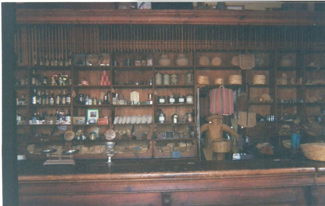
IMAGEN 10: Centro Regional de Cultura de Otumba