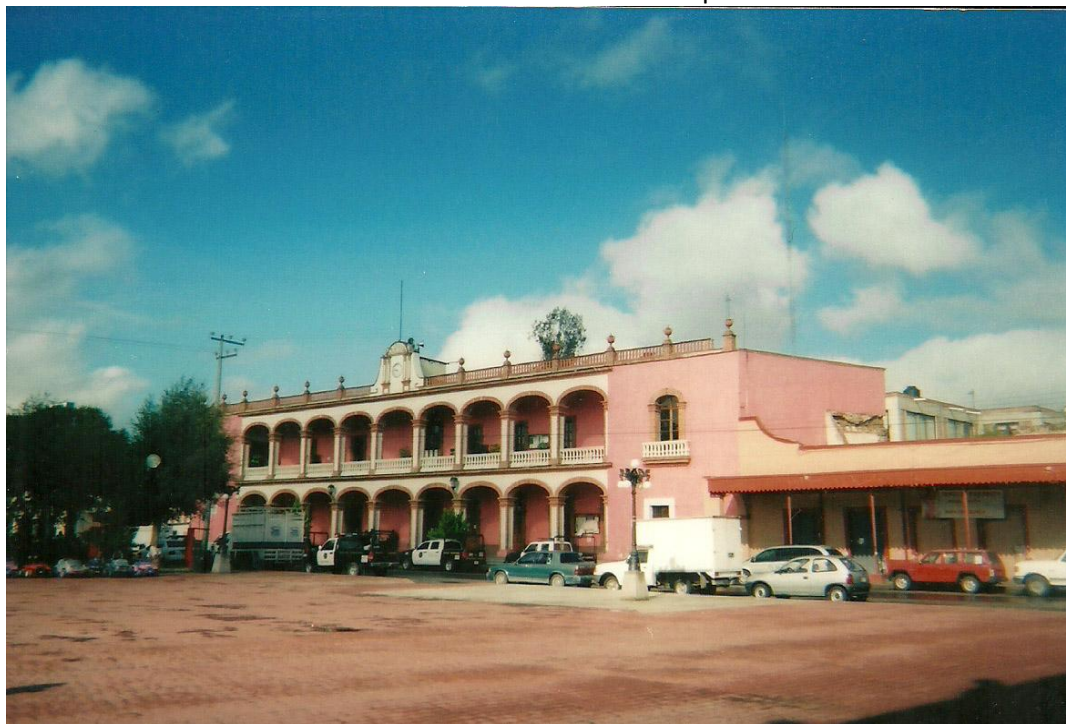
IMAGEN No. 3: Palacio Municipal