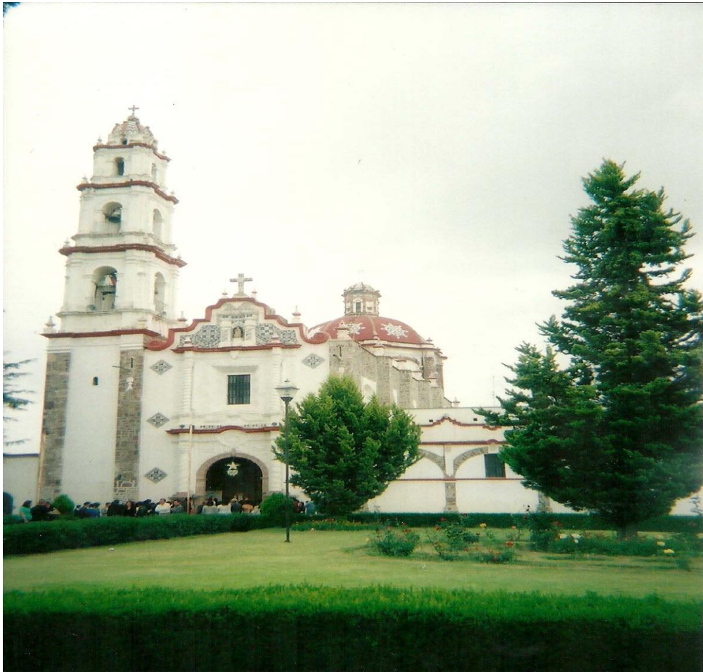
IMAGEN No. 6: Parroquia de San Esteban