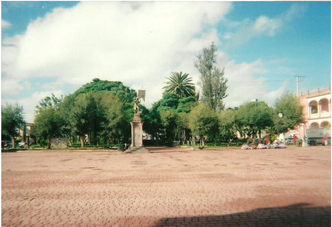
IMAGEN No. 4: Plaza de la Constitución