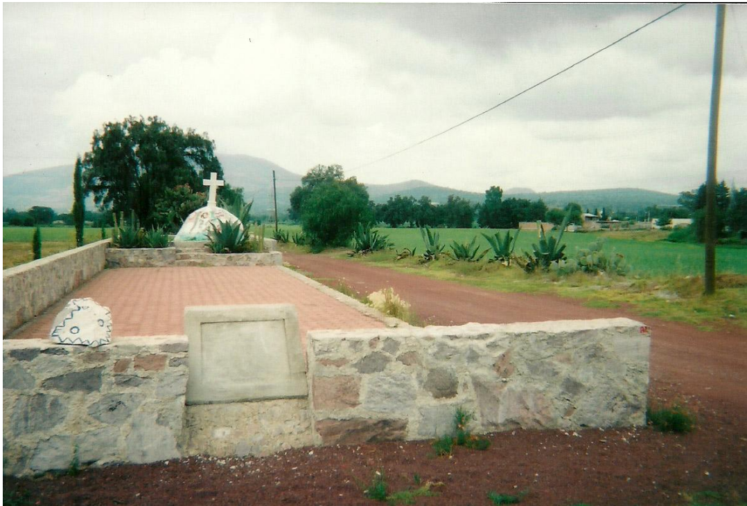
IMAGEN No. 5: Cruz de la batalla de Otumba