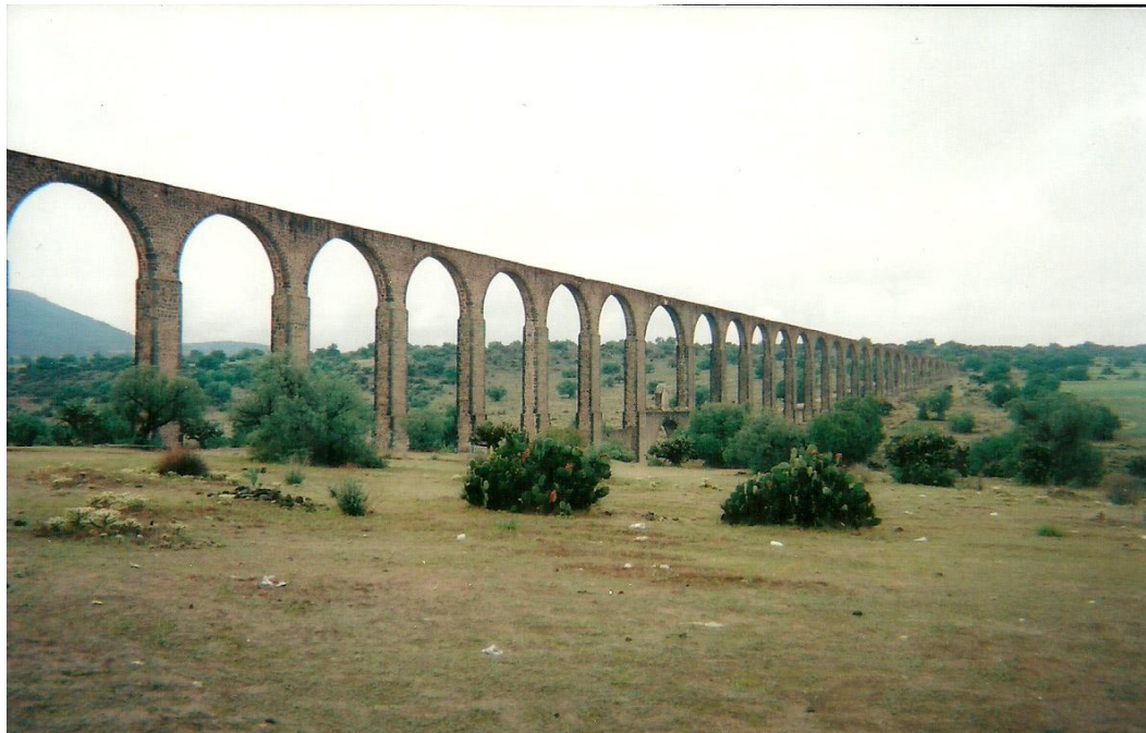
IMAGEN 12: Arcos de Zempoala o del Padre Tembleque