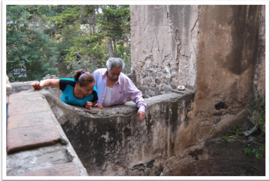
Figura 4.5 Personas platicando entre ellas “Aquí se molían las flores”.