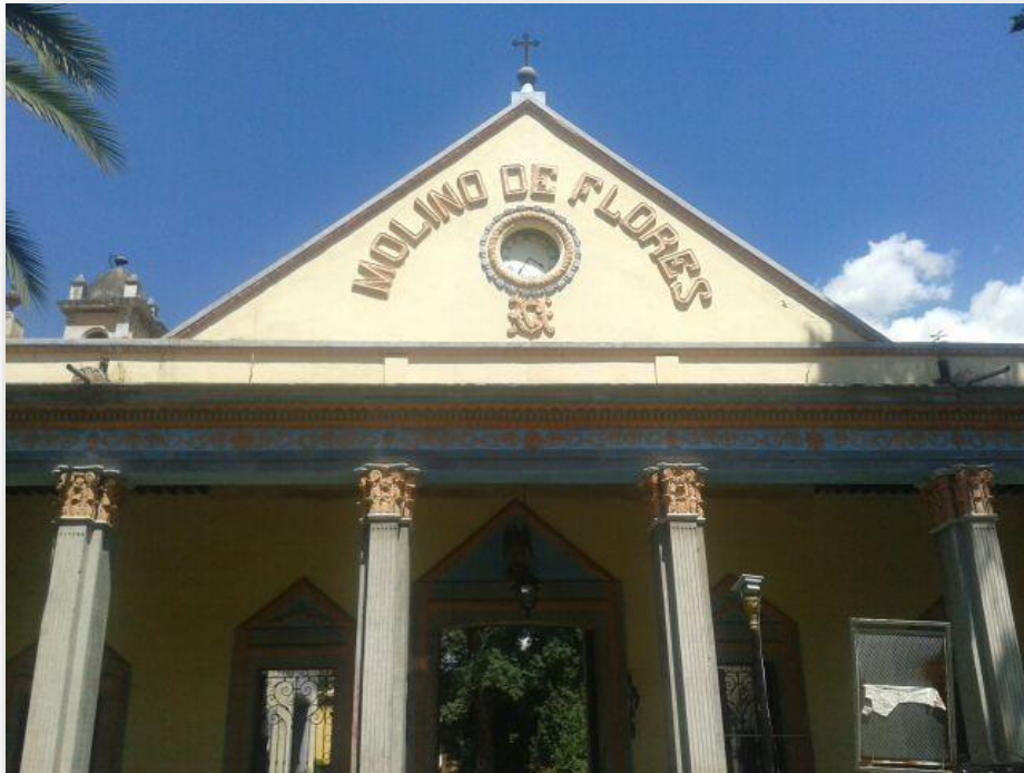
Figura 1.1. Portico de la Ex-hacienda Molino de Flores.