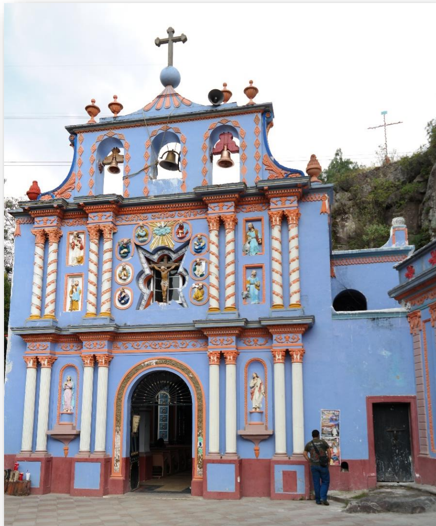
Figura 1.3 Capilla del señor de la Presa.