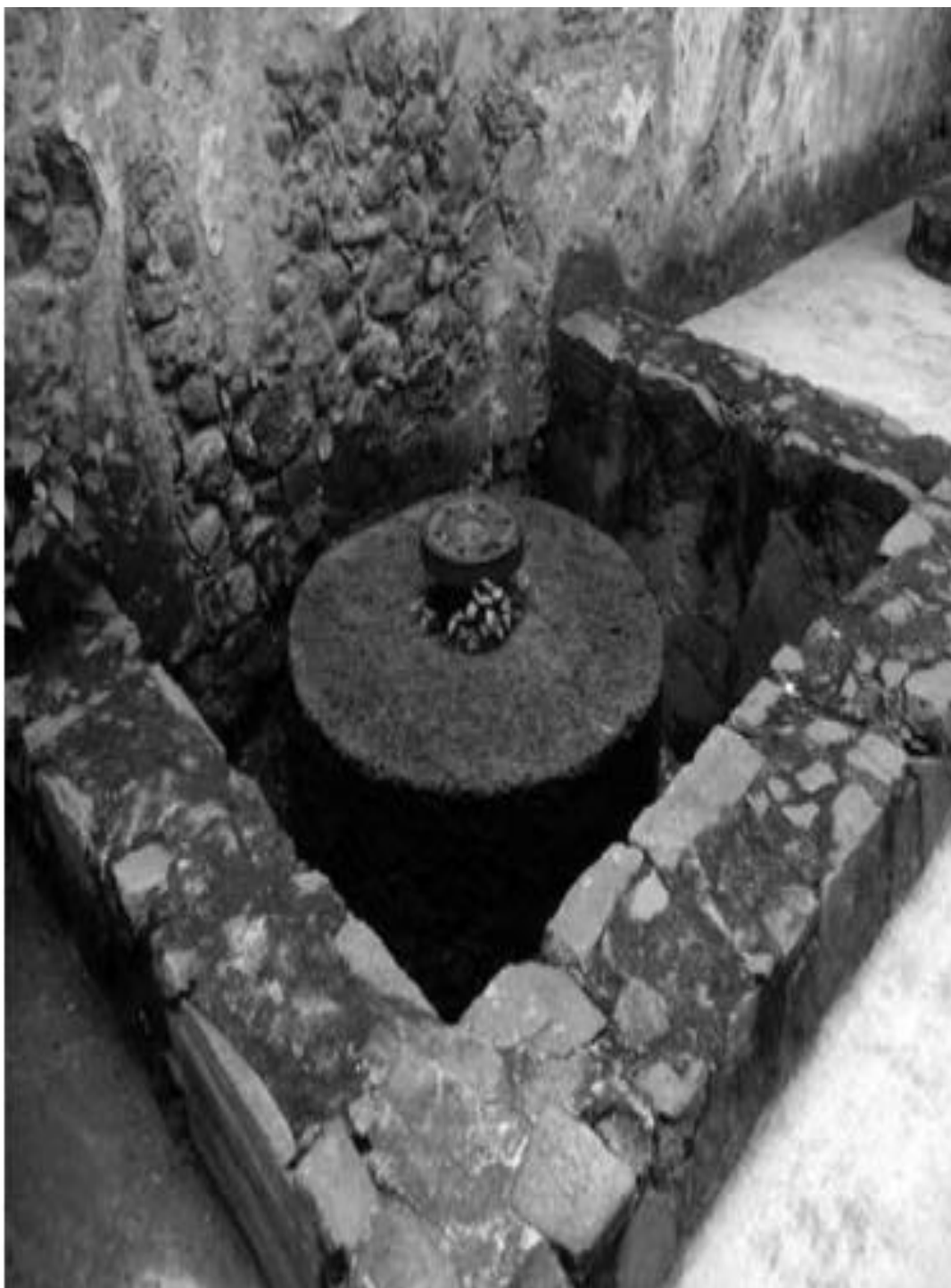
Figura. 4.3 Base fija del Molino de Trigo (PNMF)