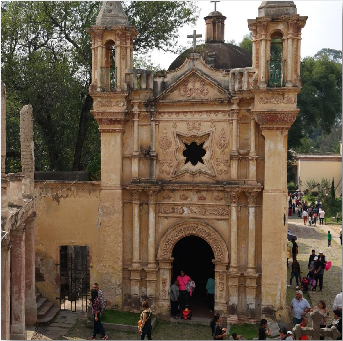
Figura 1.2 Capilla de San Joaquín