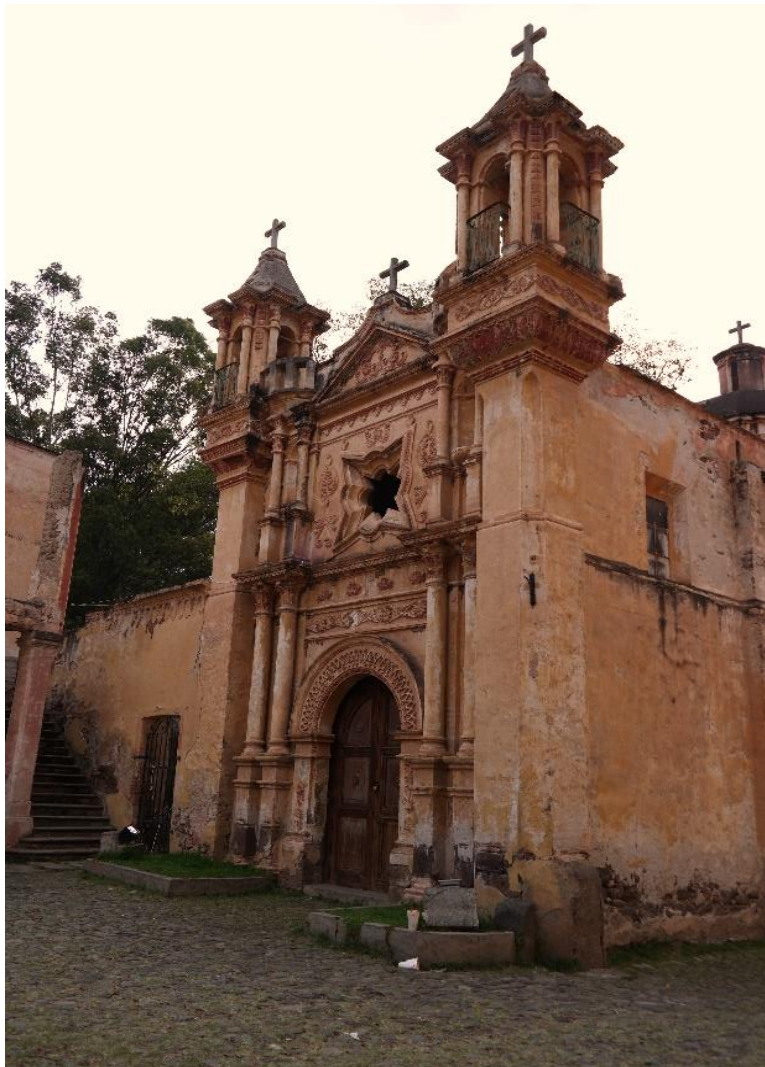
Figura 4.6 capilla de San Joaquín