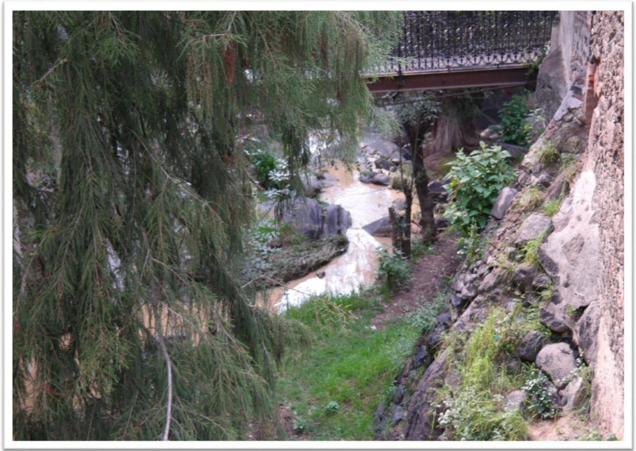
Figura 5.3 área de vegetación en el Molino de Flores.