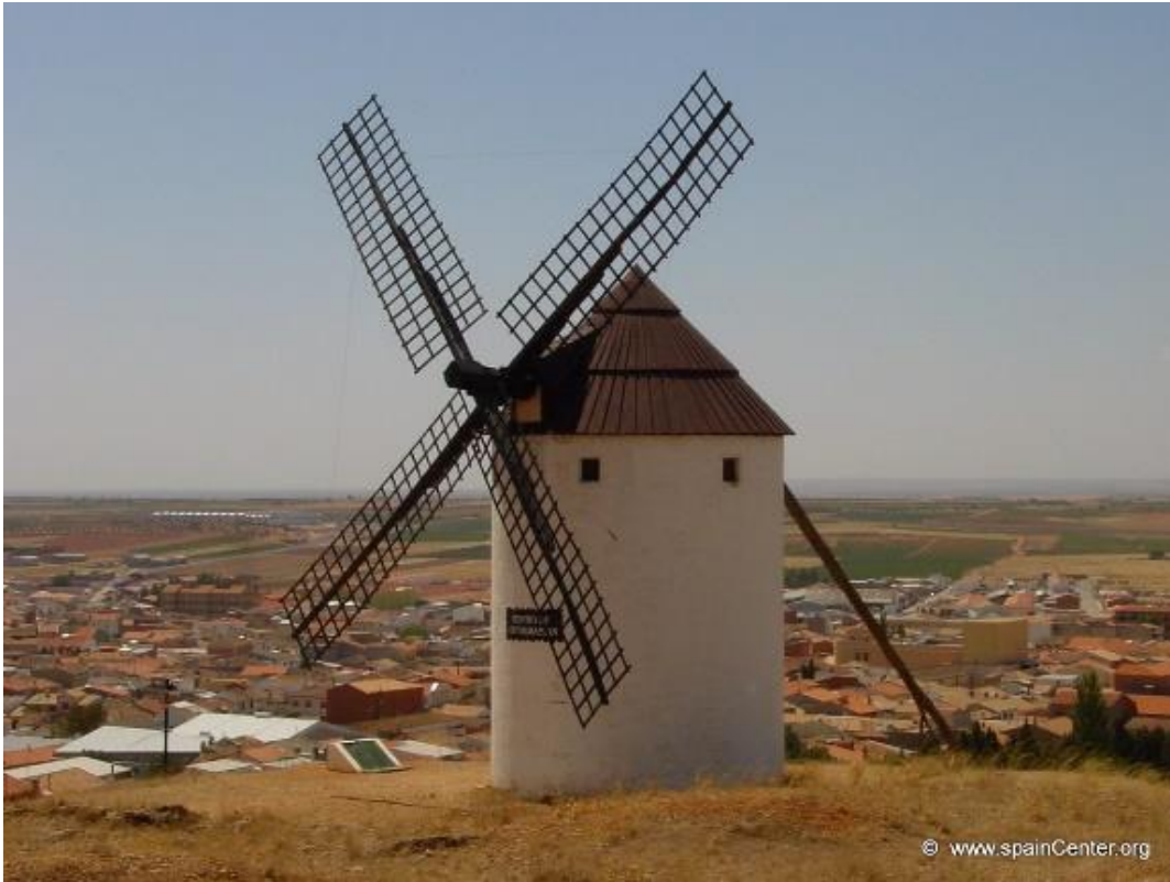
Figura 4.2 Molino de viento en Manchegos, Castilla la Mancha.